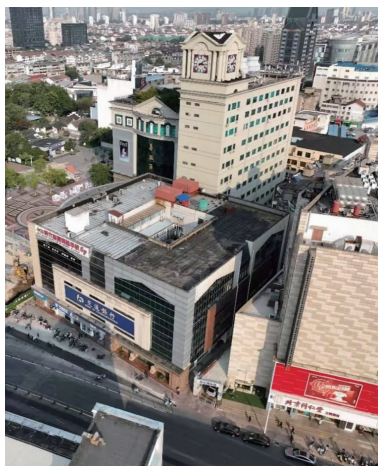
拍卖的建筑 交通银行供图