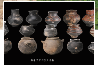
崧泽文化J1出土器物