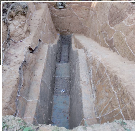
石岭头坝体堆筑土分垄现象