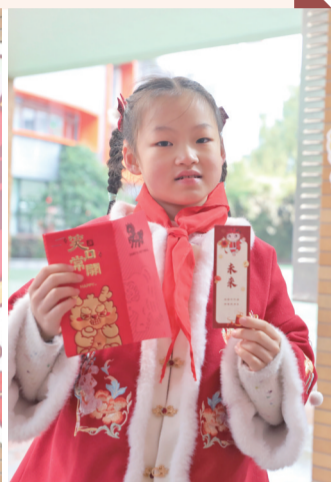
孩子领到龙年福气签