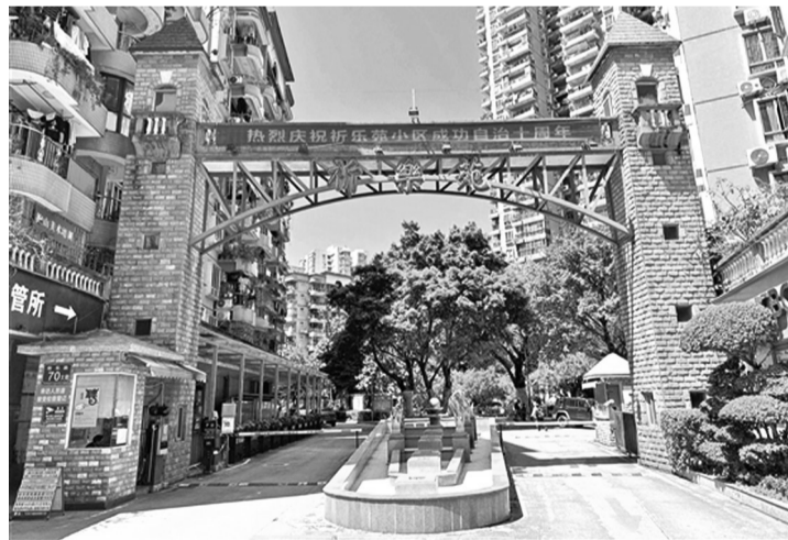
广州市海珠区祈乐苑小区