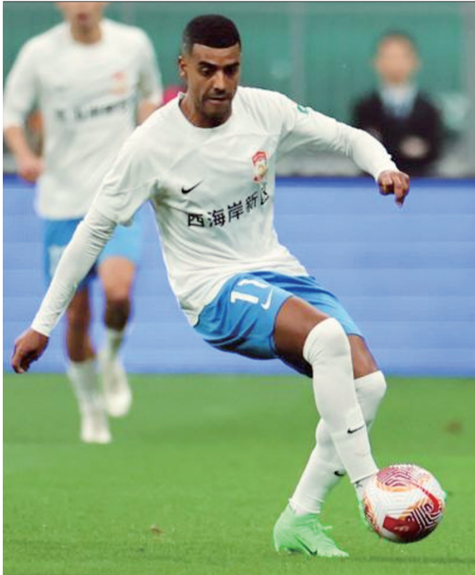
阿兰时隔两年再度入选国家队，能扛起进攻大旗吗