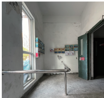
4栋(左)和1栋1楼入户大厅的护栏