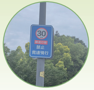
这样的限速牌沿途有14块