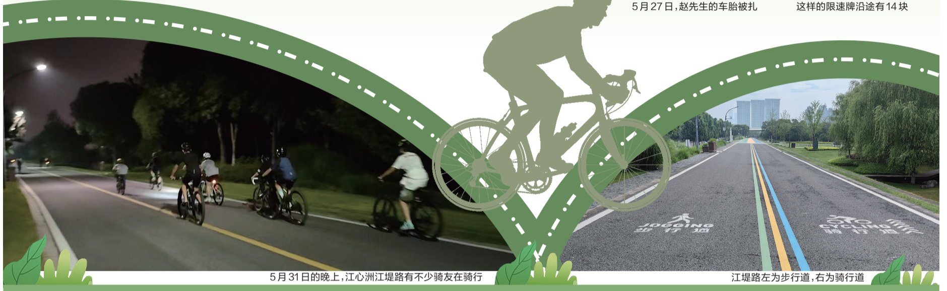
5月31日的晚上,江心洲江堤路有不少骑友在骑行