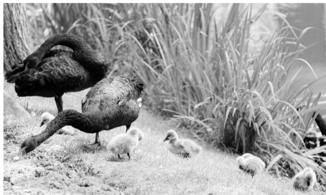
5只黑天鹅宝宝报到

现代快报讯(通讯员 武家敏 记者 谢喜卓)6月12日,在南京绿博园的小河里,一对黑天鹅带着出生不久的5只天鹅宝宝,在水中戏水、觅食,画面十分有爱。