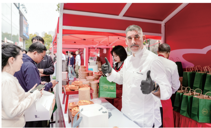
美食节让市民尽情享受美好“食”光

作为全球美食风向标,“米其林指南”和“米其林餐厅”是全球餐饮领域高品质的代名词。在此次服务消费招商推介会上,南京鼓楼成功摘“星”,吸引了16家“米其林指南”餐厅及20家高端餐饮品牌齐聚一堂,为市民带来粤式点心、地道京韵、诱人川香、西班牙和法国风味等国内外的“味觉盛宴”,把世界各地的美食体验带进南京。活动期间每天从10点到21点,主厨分享、乐队表演、美食品鉴……精彩不“打烊”,越夜越精彩。