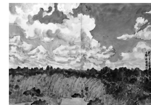
《鄂托克前旗的天空》