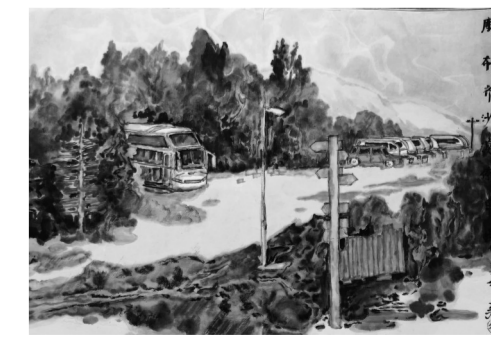
《库布齐沙漠停车场》