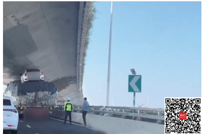
网传卡车被“卡”视频截图 扫码看视频

现代快报讯(通讯员 宁交轩 记者 谢喜卓 王瑞)11月3日,一条“卡车卡在了卡子门”的视频,刷爆了南京人的朋友圈。现代快报记者从南京交警获悉,网传消息不实。原来外地驾驶员误上卡子门立交,迷路后停车,不过车辆并未被卡。