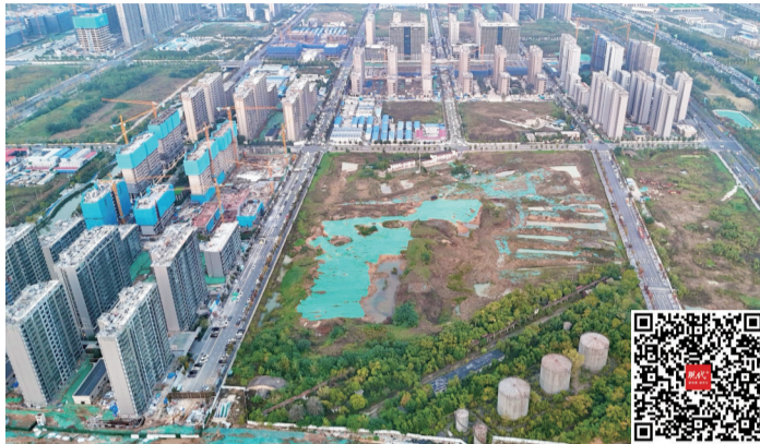
张昭墓所在的南部新城油库公园地块 扫码看视频