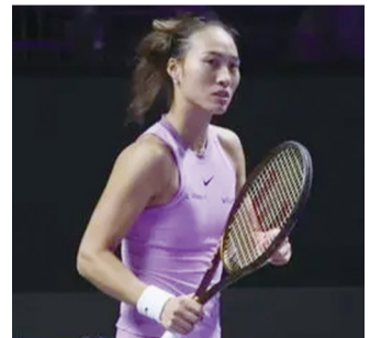
郑钦文在比赛中