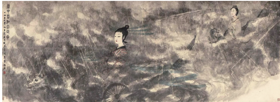
傅抱石《云中君和大司命》114x315cm 1954年

一个阶段是大胆落笔，他甚至还借助酒，在微醺状态中把人世或者社会给予他的枷锁、规范解除了，这就有魏晋人的风格解衣磅礴，吟诗作画的时候上衣都脱掉了，无拘无束，所以他第一就是要做到无拘无束，但这只是他创作的第一个阶段。