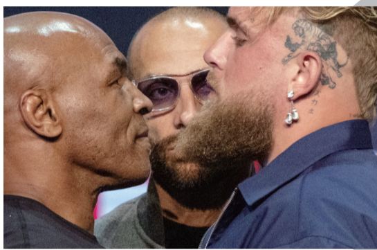
58岁的拳王泰森(左)与27岁的美国网红拳手杰克·保罗共同出席赛事新闻发布会

泰森说：“如果我赢了，我将成为流传千古的传奇。如果我表现不佳，我宁愿死在拳台上，而不是躺在医院的病床上。”