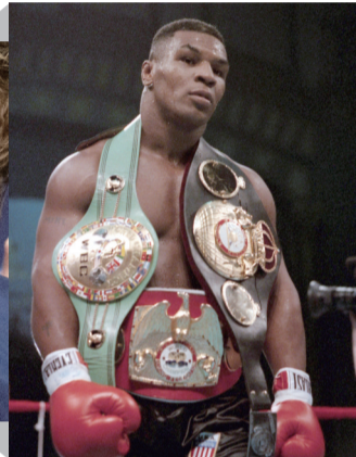
组织重量级冠军，泰森是无可争议的“拳王” 斩获WBC、WBA和IBF世界三大拳击