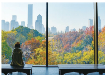
六朝博物馆“最美落地窗”