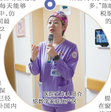
医院工作人员介绍数字家庭化产区

近年来,阜阳市加大对医疗卫生事业的投入,实现县域内三级公立医院的全面覆盖。此外,主动与长三角地区优质医疗资源对接,引进名医名家来阜开设名医工作室、定期坐诊,公共服务更加便利共享。