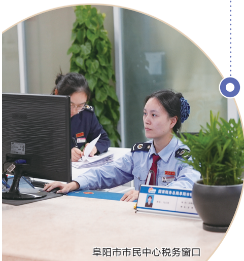
阜阳市市民中心税务窗口

阜阳市面积10118平方公里,总人口1081万,是全国为数不多的人口超千万地级市之一。在总体规划沙盘演绎展厅,由1:1000比例构造而成的微缩版的阜阳市总体规划模型尤为震撼。站在透明玻璃栈道上,大家以鸟瞰的角度观察这座“阜阳微型城”,伴随着城市规划宣传片对阜城市情、发展规划等的讲解,并辅以灯光、音响效果,一座“大美阜阳”城展现在大家面前。