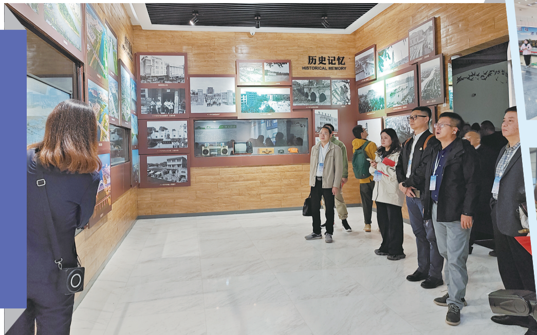
参观阜阳市城市规划展示馆