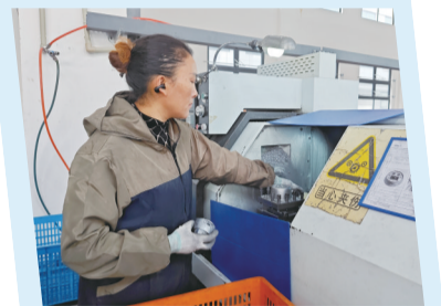
栋玛仕公司生产车间