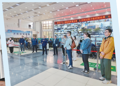
安徽昊源化工集团有限公司