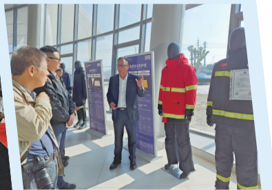
吉祥三宝高科新材料有限公司