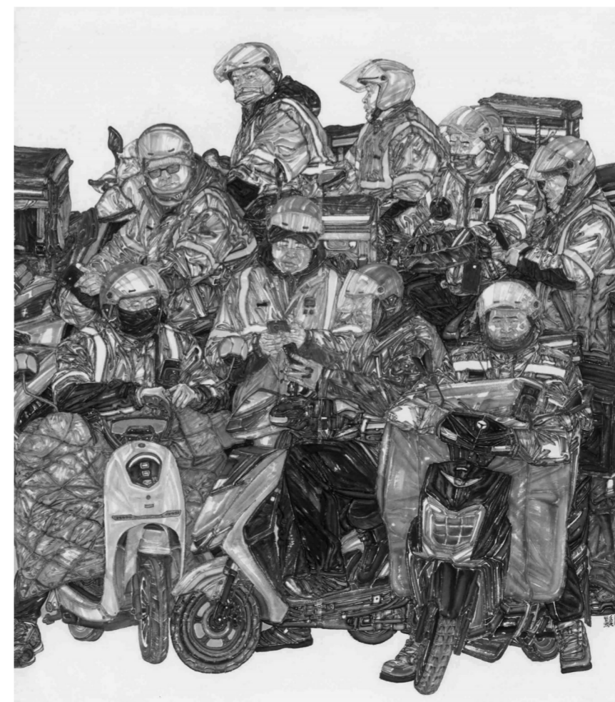
《外卖小哥》220cm×200cm 纸本水墨 2021年