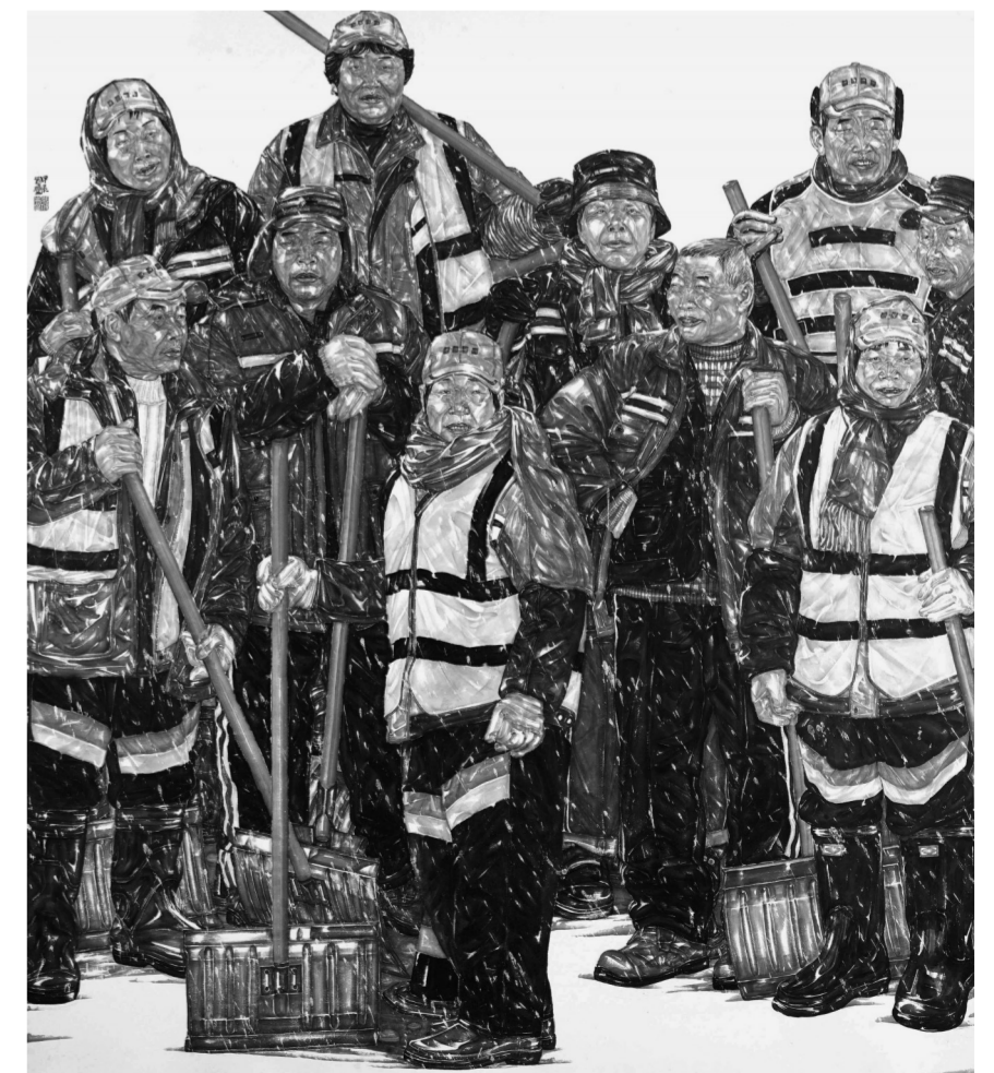
《瑞雪兆丰年》225cm×200cm 纸本水墨 2024年