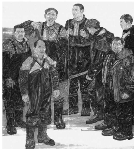
《渔歌唱晚》225cm×200cm 纸本水墨 2021年