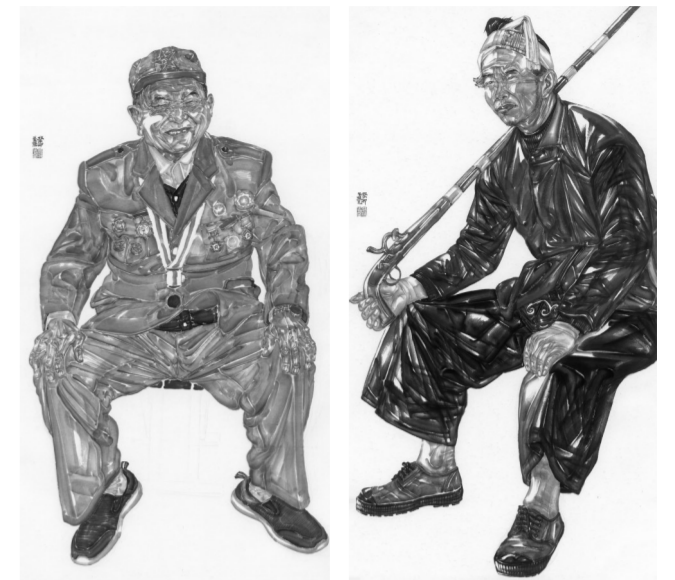
《老兵-2》180cm×97cm 纸本水墨 2023年

水墨为上其实在于中国画笔墨语言内核的精密程度,将笔、墨、形三者相互串联起来,各司其职,并以水墨的形式表现出物象的形与质,这才是水墨为上的优势所在。不仅如此,水墨为上实则是笔、墨、形三者有机结合起来,并通过书串联起来,互通有无,融为一体,这样水墨为上才能落到实处。同时,水墨为上的高度还在于“写”,只有在创作中不断感悟“写”的内涵,拓宽“写”的视野,打磨“写”的质量,水墨才能为上。