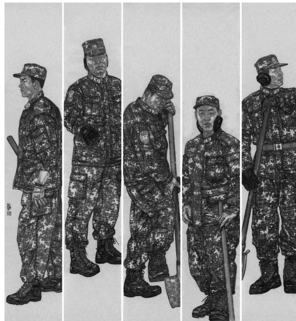
《守护一方》223cm×200cm 纸本水墨 2022年