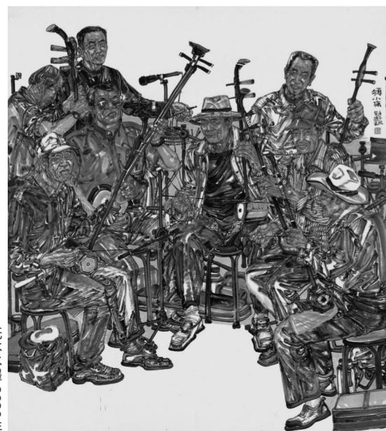
《窑小康》225cm×200cm 纸本水墨 2020年