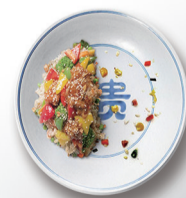
俭以养德 杜绝浪费