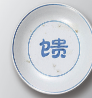
大地馈赠 拒绝浪费