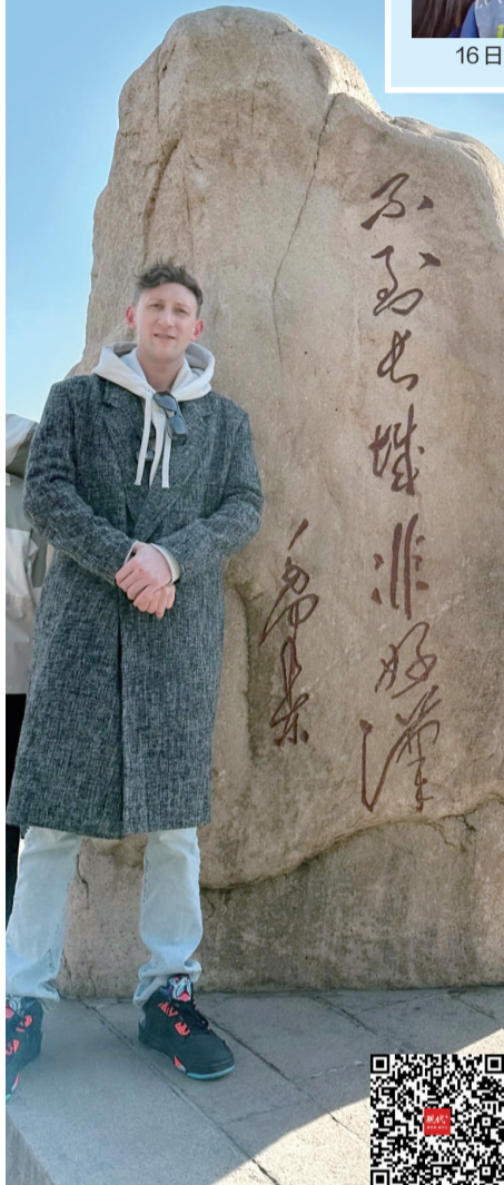
埃文爬长城 扫码看视频

埃文的中国之行还在继续。“我很期待能够体验中国的文化,感受中国历史,结识中国人民。我也想看看,相比相册中记录的那个中国,它在过去100年里发生了哪些变化。”埃文说。 现代快报/现代+记者 龙秋利