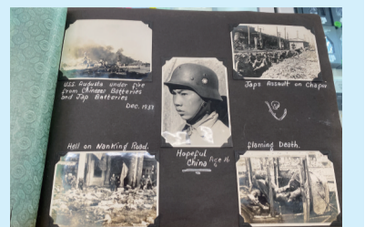
二战相册其中一页