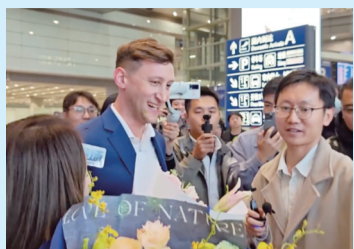
16日晚,埃文落地北京受到热情迎接