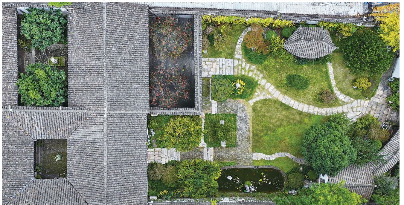
南京魏源故居

现代快报/现代+记者 王凡 王子扬 毛晓华 王晓宇 庄剑翔 东台融媒 陈美林 通讯员 顾秀文