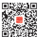
扫码关注江苏文脉公众号