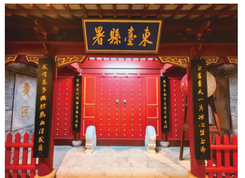
复原的东台县署挂着魏源的两副对联——“上有青天,一片冰心盟上帝;民皆赤子,满腔热血注民瘼。”“民不可欺,常忧获戾于百姓;官非易作,唯愿推恩到万家。”