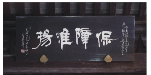
兴化古县署的牌匾“保障淮扬”

1850年,连云港,57岁的魏源被派去整治两淮盐务,来到板浦镇,兼任两淮都转盐运使司下属淮海州分司运判。 1851年,魏源升任高邮州知州,他筑高邮湖大堤,改建文游台为书院,还抽空整理著述,完成了《元史新编》。 世乱多变。 年逾六旬,魏源辞职,举家迁居兴化,寄寓西寺。 归隐山林,他开始了自己潜心学佛的老年生活,活成了一个传奇。 咸丰六年(1856)秋,他去杭州游览。次年农历三月初一,在杭州东园僧舍去世,终年64岁,葬于杭州南屏山方家峪。 今年是魏源诞辰230周年。让我们一起致敬先贤,传承薪火。