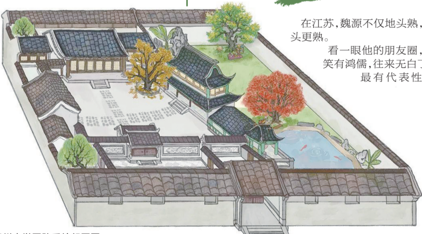
扬州大学团队手绘聚园图