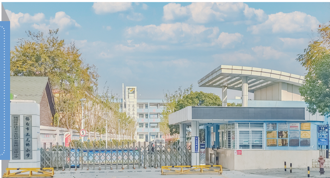
学校风景

为弘扬雷锋精神,传递社会正能量,三元桥小学特别组织了“大爱扬城”主题活动。本次活动旨在通过参观展览的形式,让少先队员们深入学习雷锋精神,了解学校的献爱心事迹。