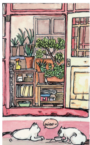
故宫办公区域城隍庙一角