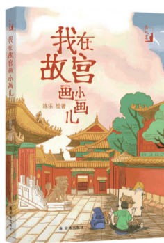
《我在故宫画小画儿》 陈乐 绘著 译林出版社

昵称阿乐，故宫博物院员工。闲暇时间喜欢四处旅行、画小画儿记录生活，曾出版三本旅行绘本。于2017—2019年间为月刊《紫禁城》杂志撰写并绘制《阿乐画故宫》专栏。绘制的故宫“小确幸”笔记本于故宫各个平台销售，广受欢迎。从2017年3月至今运营微信公众号“我在故宫画小画儿”，分享手绘的故宫风景与故宫各类知识科普。