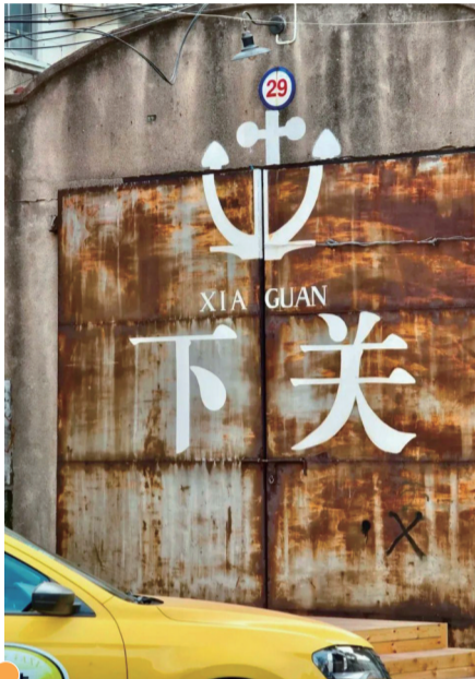
101明湖里园区的“下关”门