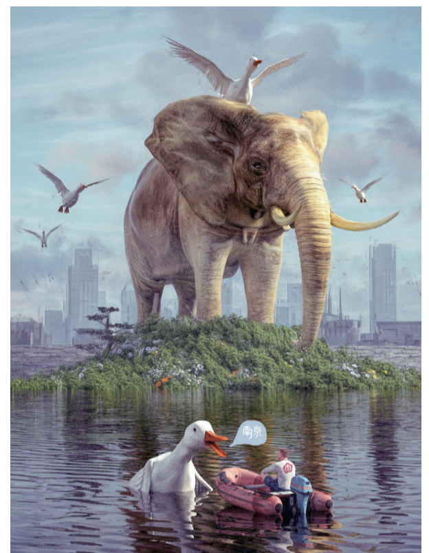
Beeple在南京创作的《金陵》

到访南京期间,Beeple在玄武湖畔完成了《每一天》系列的第6407件作品——《金陵》。这幅作品南京元素满满,包括鸭子、南京地铁标志等特色符号。同时,受到“最美600米”明孝陵石象路的启发,Beeple还将大象作为画作主角。Beeple表示,艺术创作是一个有趣的过程。“我想用这幅作品表达的是,艺术是有趣的,创作是为了获得快乐。”