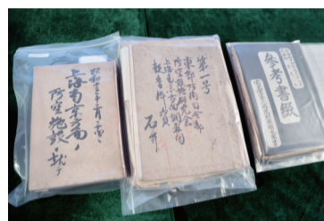
石井桂的调查报告《关于上海、南京的防空设施》等