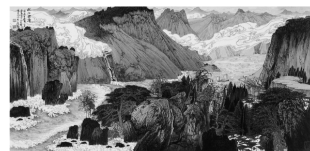
《秋江云涛》70cm×145cm 中国画 2012年

1956年出生于江苏靖江。1982年毕业于南京艺术学院。毕业后至1997年任新华日报美术编辑,1997年工作于江苏省国画院。江苏省书画院院长,现为中国艺术研究院研究员、中国艺术研究院博士生导师,南京大学特聘教授。江苏省文史馆馆员,江苏省文联委员,江苏省美术家协会副主席、山水画艺委会主任,江苏中国画学会副会长。曾任江苏省国画院副院长。国家一级美术师,享受国务院政府特殊津贴专家。