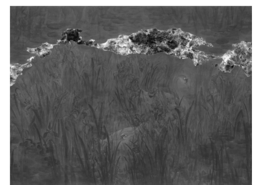
《月光》 240cm×200cm 中国画 2024年

1986年2月生于江苏南京。2012年6月毕业于南京艺术学院美术学院中国画花鸟工作室,并获硕士学位。现任职于江苏省书画院,江苏省美协会员,三级美术师。