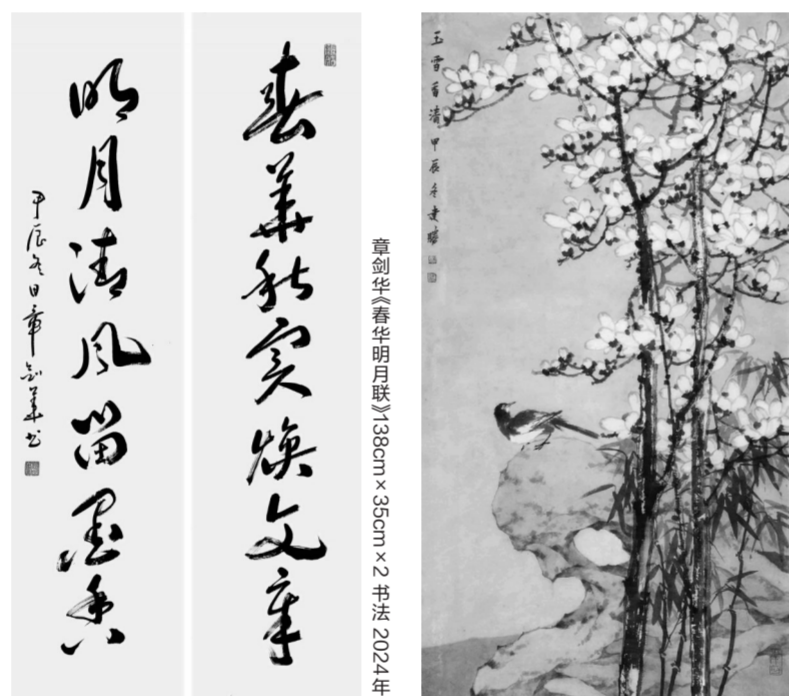
高建胜《生香清》180cm×97cm 中国画 2024年

笔名立早,江苏宜兴人,文学博士,国家一级艺术监督。现任江苏省文联主席、省当代艺术创作研究会会长、省报告文学学会会长,曾任江苏省委宣传部常务副部长、省广电总台台长,原省文化厅厅长、省人大教科文卫委员会主任等职。现为中国文联委员、中国作家协会会员、中国书法家协会会员、中国报告文学学会理事,南京艺术学院讲席教授,南京大学、东南大学、南京航空航天大学、省委党校等兼职教授、博士生导师。