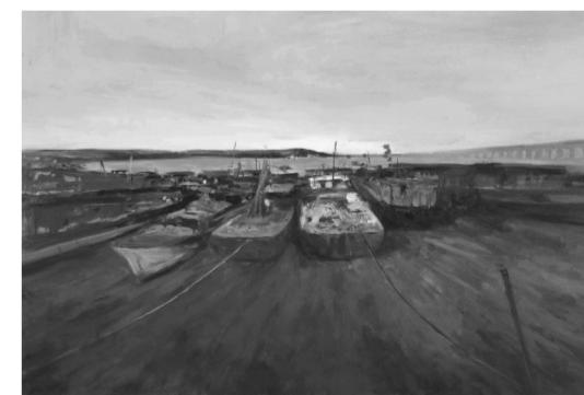
《渔港》 80cm×120cm 油画 2024年

生于江苏无锡,毕业于云南大学艺术与设计学院,获硕士学位。现任职于江苏省书画院,中国美协会员。