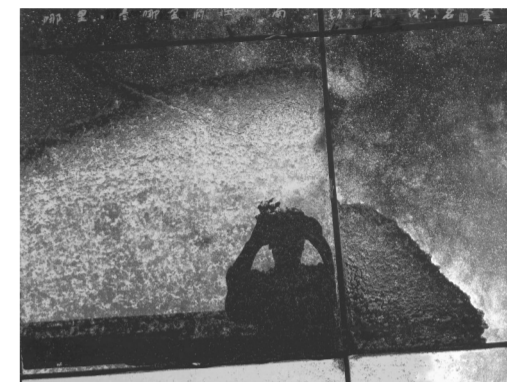
《哪里是哪里》 110cm×144cm 中国画 2024年

1943年1月生于徐州沛县,1964年南京师范大学美术系毕业,国家一级美术师,国务院政府特殊津贴专家。历任江苏省国画院院长、名誉院长,中国美协、书协理事,全国美展总评委,江苏省书法研究院院长、名誉院长,江苏省书画院名誉院长,江苏省书法院顾问,中国国家画院研究员,中国画学会常务理事,江苏省文联副主席、党组副书记、顾问,原省文化厅副厅长、巡视员,江苏省少儿基金会终身荣誉理事长等。