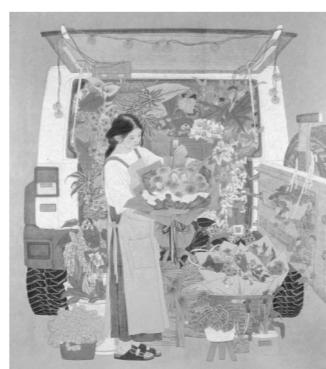
《一路花开》 230cm×200cm 中国画 2024年

又名杨静,河南固始人。2009年毕业于南京师范大学美术学院中国画系,获硕士学位,现任职于江苏省书画院,江苏省徐悲鸿研究会理事。中国美术家协会会员,二级美术师。获得2019年江苏省“紫金文化人才培养工程”文化优秀称号。