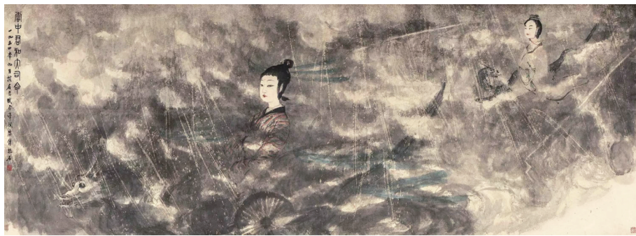
傅抱石《云中君和大司命》114×315cm 1954年

画面,待矾水干后,再泼墨,雨渍则自然形成。而这种潇洒的技法,伴着“燕市酒人”“往往醉后”(两方常用印)的状态,加以飞速用笔与大胆泼墨,自然能使画作神形完备。但这种醉应该不是不可控的,毕竟傅抱石的画初看狂放,细看却尽是门道:画作中人的轮廓、面目、服饰不能被污染,而风雨雷电又不能没有气势,二者的相合,是“大胆落笔,细心收拾”的完美体现,这从傅氏治印“余之画不过草草”“具体而微”可得旁证。《菜根谭》有“花看半开,酒饮微醺,若即若离,似远还近”句,