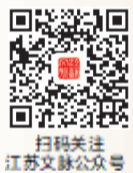
扫码关注 江苏文脉公众号