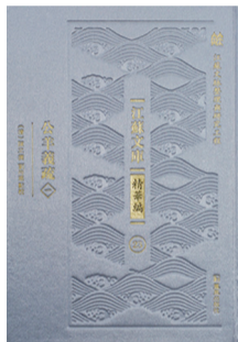
《江苏文库·精华编》之《公羊义疏》