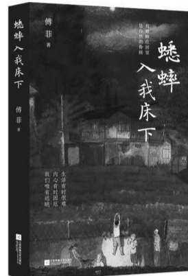
2024年3月 江苏凤凰文艺出版社 《蟋蟀入我床下》 傅菲

傅菲，这位深耕乡村、情系自然的作家，近年来以其深邃的情感和细腻的笔触，在文坛上赢得了广泛的关注与赞誉。《蟋蟀入我床下》作为他田野考察之余的生活美学之作，更是对乡村生活的深情回望，以及对自然、生命及人类生存状态的深刻反思。