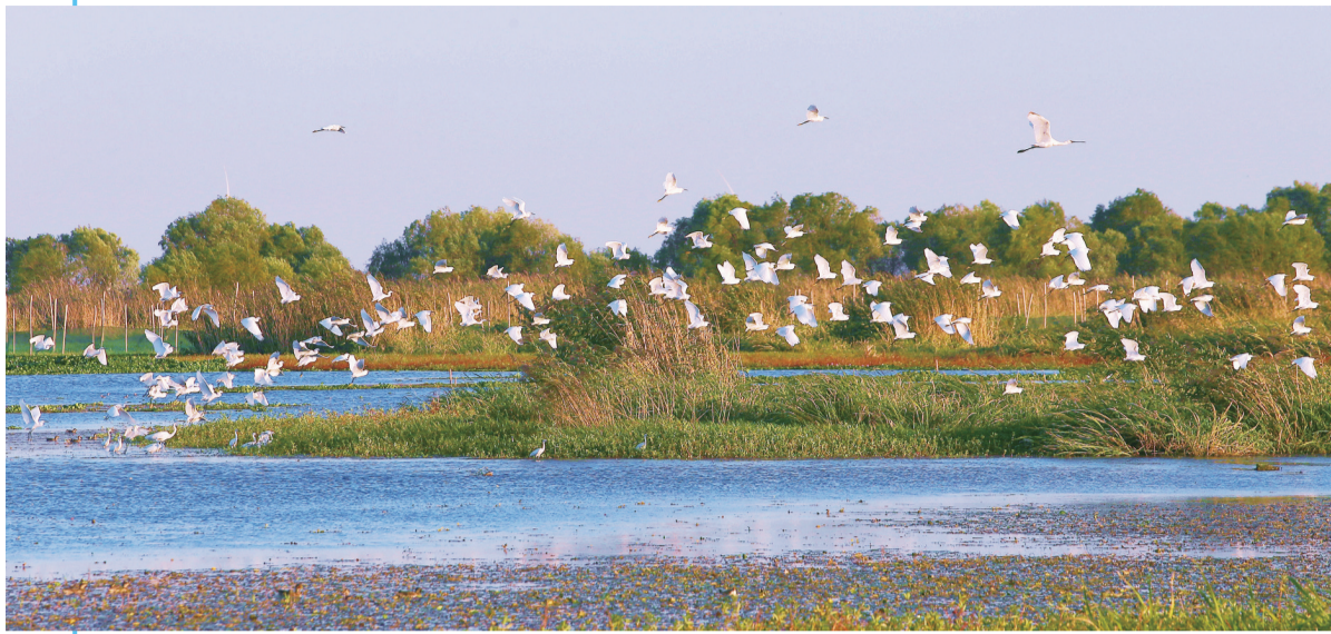
金坛长荡湖湿地