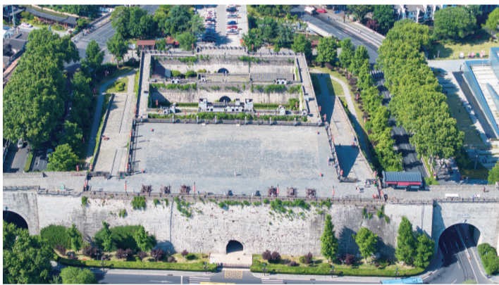
南京城墙申遗基础性工作已基本就绪