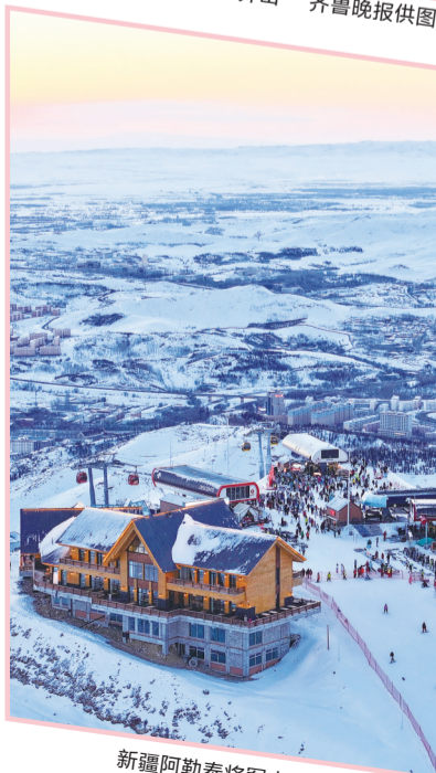
新疆阿勒泰将军山国际滑雪度假区