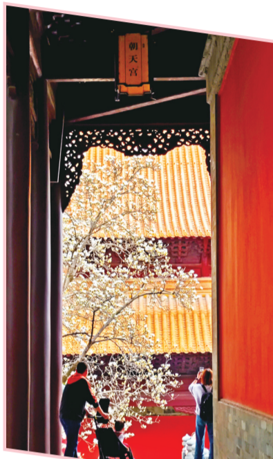
南京朝天宫的玉兰花开了

2025年全国两会期间，现代快报/现代+发起，齐鲁晚报、新疆广播电视台丝路视听联动采访了多位代表，乘着春季旅游热潮，共同探讨城市文旅高质量发展之道。