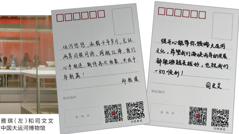
两人写下的明信片