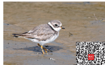
剑鸻 扫码看视频

现代快报讯(通讯员 杨福建 记者 郑阳)近日,一段名为《吃饭抖腿的剑鸻(héng)》的视频在徐州鸟友圈中走红。暖阳下,一只银灰色的鸟儿正悠闲地在滩涂踱步。它每走几步便轻轻抖动一次橙黄色的脚爪,随后低头迅速啄食。