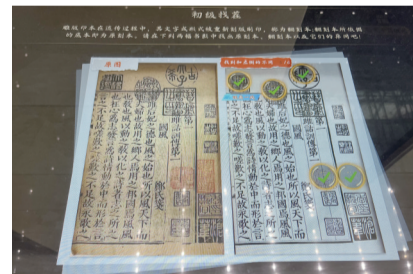
在“找茬”游戏中体验古籍校勘

现代快报讯(记者 刘静妍)近日,南京图书馆推出了全新“古籍互动小游戏”。在图书馆一楼大厅,通过动画演示和互动操作,读者可以边玩边学习古籍知识。