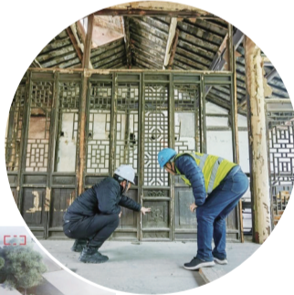
▲ 工程人员现场研究修缮技术