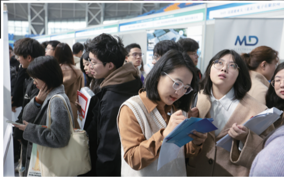
招聘会现场求职学生络绎不绝