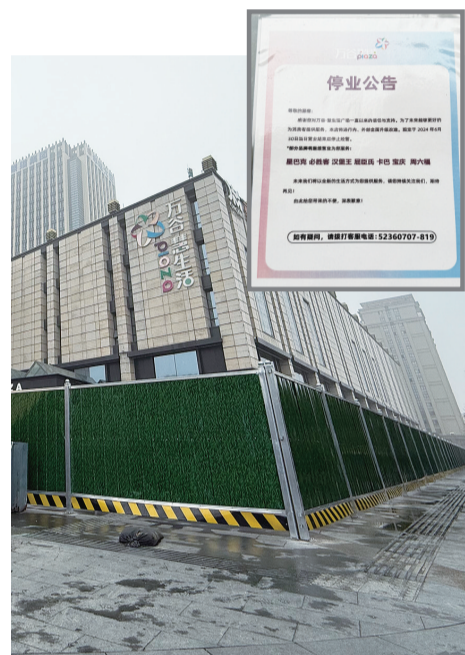
商场周边拦着围挡,还贴出了停业公告

据了解,这座商场开业于2015年,原本有餐饮、购物、电影院等众多业态。周围居民介绍,里面还有一家电影院,逢年过节生意不错,也带动了餐饮消费,但2023年关闭了。“商场说是升级改造,只剩一楼临街的店铺和楼上的健身房还在营业。”有市民告诉记者,商场差不多在2024年初就闭店了。