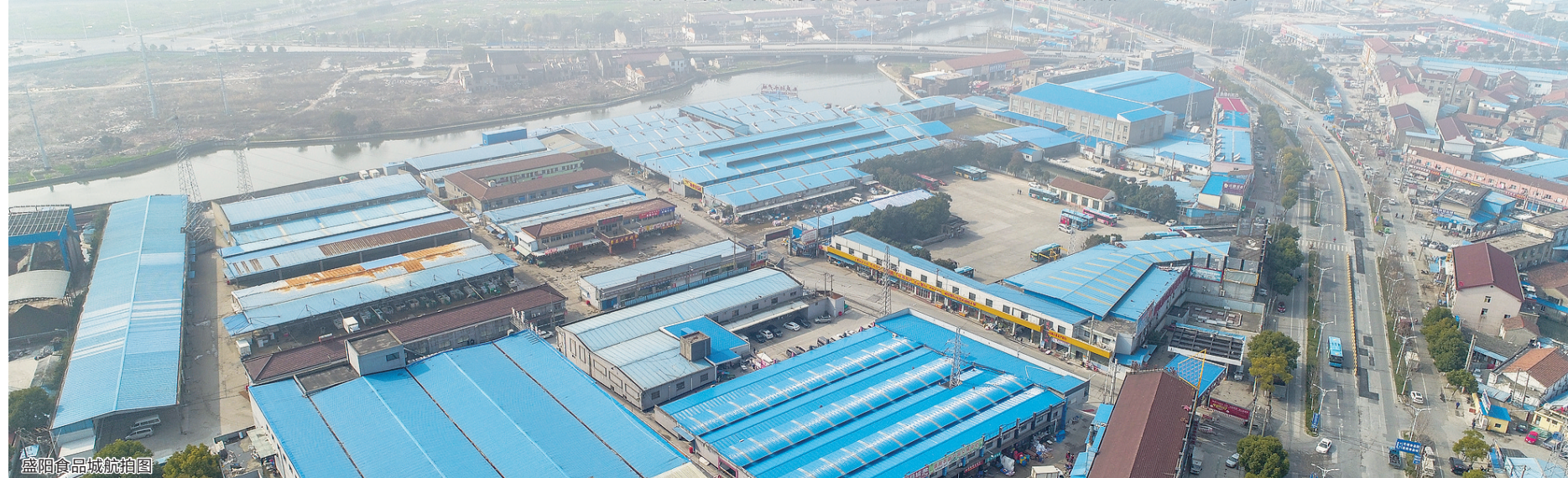
盛阳食品城航拍图