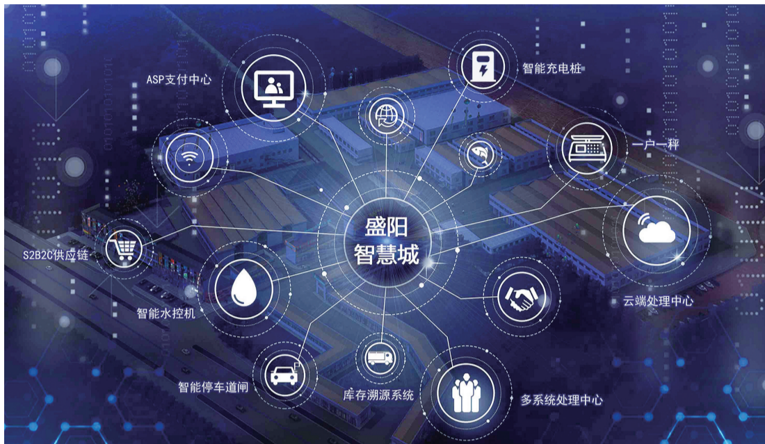
盛阳智慧城概念图

2024年3月19日无锡盛阳食品城与安徽霍邱三流乡召开产销两地水产业高质量融合发展研讨会,