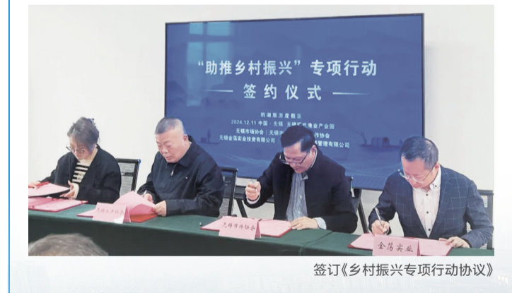
签订《乡村振兴专项行动协议》

双方明确了未来要加快推进一二三产业融合发展,严格控制风险,促进优势互补、抱团发展,推动水产产业链更快更好发展的共同目标。