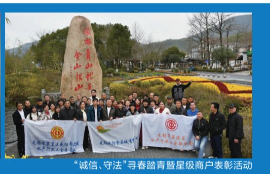
“诚信、守法”寻春踏青暨星级商户表彰活动