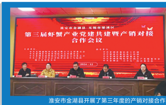
淮安市金湖县开展了第三年度的产销对接合作