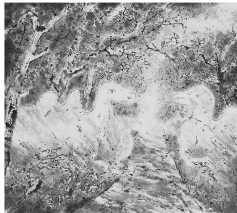
明孝陵石象路 纸本水墨