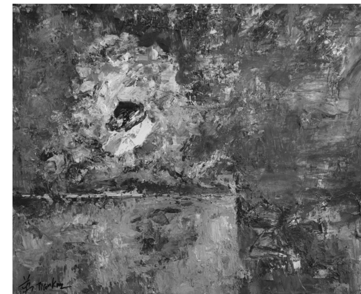
明代湖石 布面油画