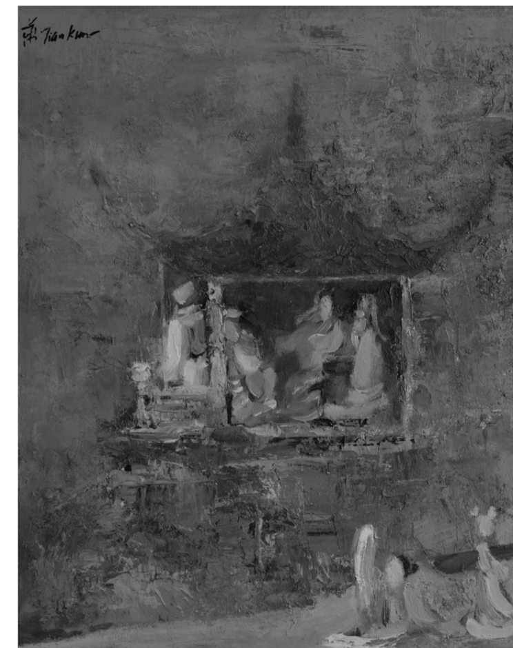
携琴访友 布面油画