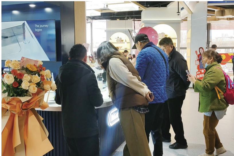
国补带动消费，市民逛商场选购