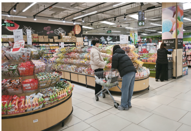
市民在永辉超市购物