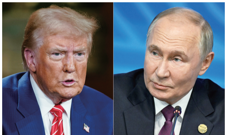
特朗普（左）和普京18日就俄美关系正常化和乌克兰局势通电话