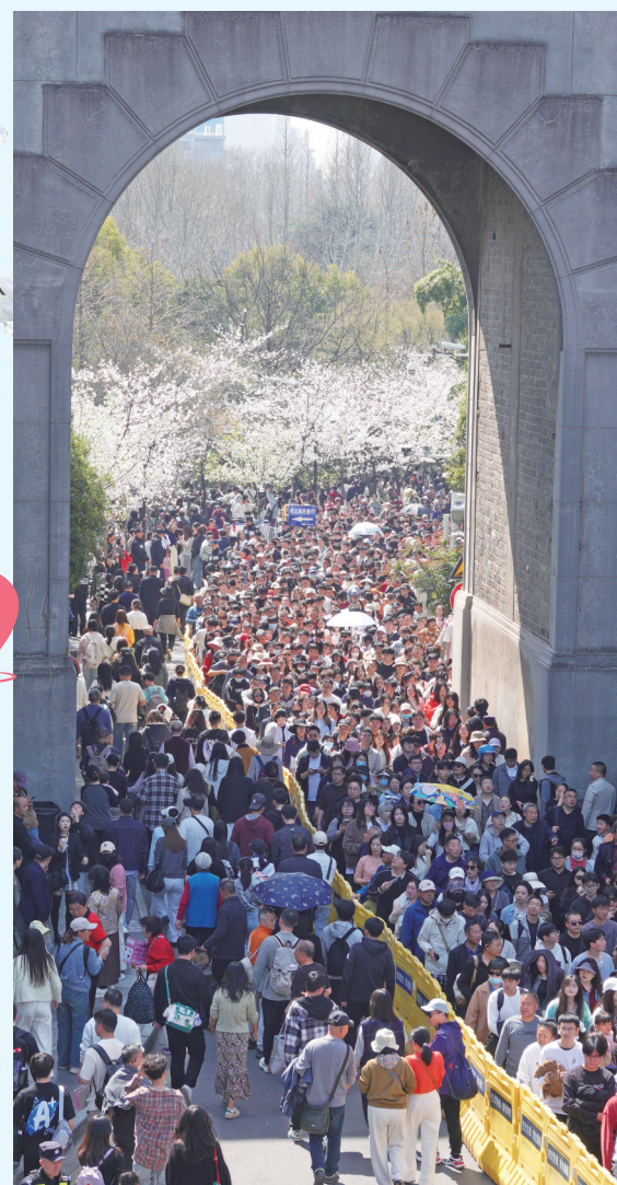
昨天天气晴好，市民游客前往南京鸡鸣寺路、珍珠河、南林大等处赏樱，人山人海看花海