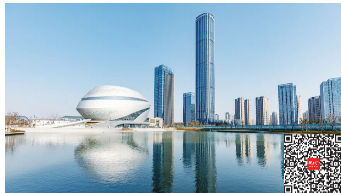
未来科幻馆造型宛如一颗跳动的心脏 扫码看视频

现代快报讯(记者 何洁 徐晓安)主题游戏、科幻秀场、量子咖啡、全景露台……3月25日,苏州相城文旅新地标——苏州·未来科幻馆正式启幕。该馆不仅外观造型科技感满满,还落地了国家级超级IP《三体》,打造了全国首个沉浸式的三体主题体验空间。