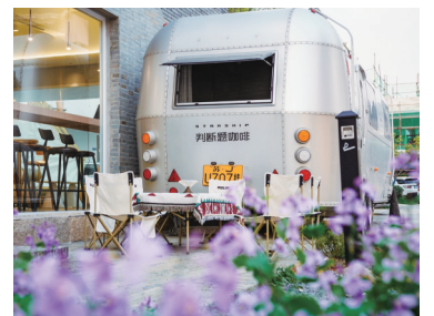
乡村咖啡馆判断题咖啡