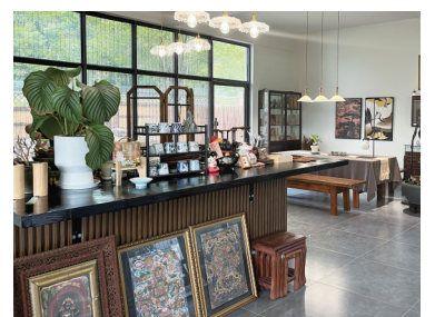
乡村咖啡馆看书书房