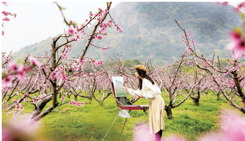
艺术高校学生桃园写生