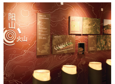
阳山火山地质文化展示馆