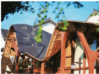
乡村咖啡馆仙木里