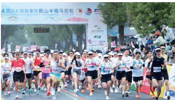
往年阳山半马现场