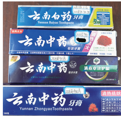
云南白药牙膏和云南中药牙膏

法院调查分析后认为,“云南中药”牙膏,未经商标注册人许可,在同一种或类似商品上使用与“云南白药”注册商标相近的