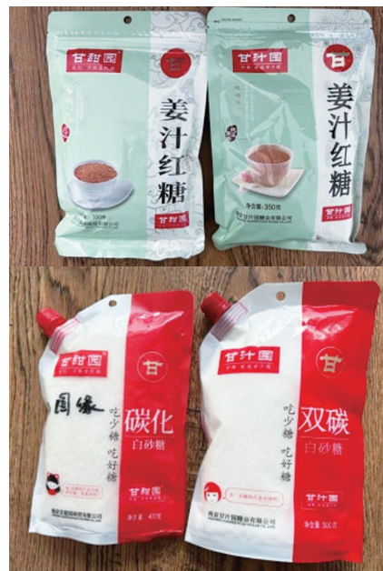
甘甜园(左)产品与甘汁园(右)产品包装对比

因商标法第十三条规定的立法目的是给予已注册驰名商标不相同或者不类似商品上更强、更高的保护,故在相同或类似商品上给予已注册驰名商标同样的保护应为该规定的应有之意。因此,根据《最高人民法院关于审理涉及驰名商标保护的民事纠纷案件应用法律若干问题的解释》第十一条规定,若被告使用的注册商标违反商标法第十三条的规定,复制、模仿原告驰名商标,构成侵害商标权的,仍应承担侵权责任,除非原告提出请求时已经超过五年期限或原告商标在被告商标提出注册申请时不驰名。