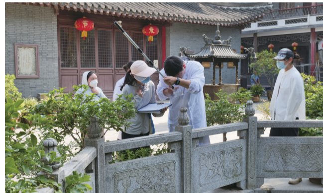
疾控工作人员在对蚊子幼虫进行监测

现代快报讯(通讯员 扬疾轩 记者 顾潇)随着气温回升,蚊虫活动逐渐活跃。4月7日,现代快报记者从扬州市疾控中心获悉,今年首波蚊已来袭,其中“花蚊子”较往年提前出现。疾控专家提醒,市民外出时需要注意防蚊,并及时清理室内外积水,阻断蚊虫孳生环境。