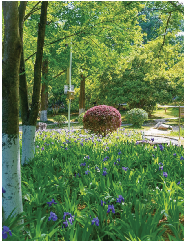
天气渐暖,南京一派春天景象

今天 白天多云,夜里多云到阴有分散性阵雨或雷雨,东南风4级左右,14~30℃ 明天 多云转阴有分散性阵雨或雷雨,偏西风4到5级阵风6级,17~31℃ 后天 多云,西北风4到5级,17~29℃左右