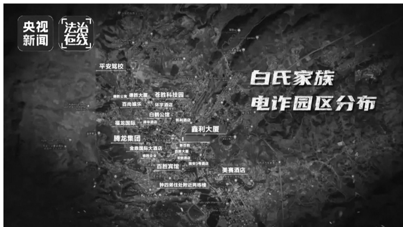
白氏家族电诈园区分布