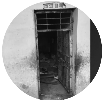
白氏集团惩戒场所