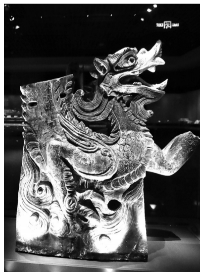
西夏陵6号陵陵城南门遗址出土的绿釉兽

又融入佛教信仰与党项习俗，形成了特殊的信仰与丧葬传统，并见证了西夏王朝在公元11至13世纪丝绸之路文化与商业交流中的独特地位。