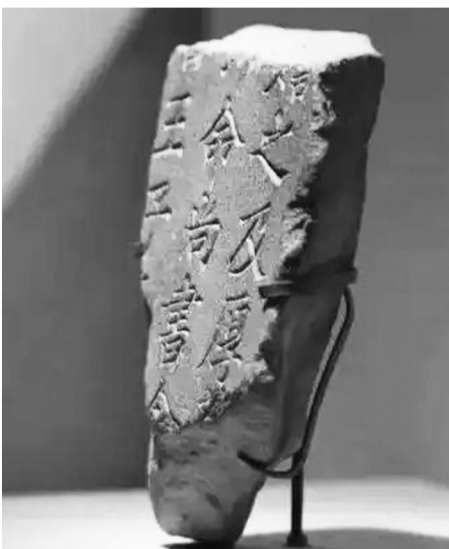
西夏残碑 据西夏陵博物馆