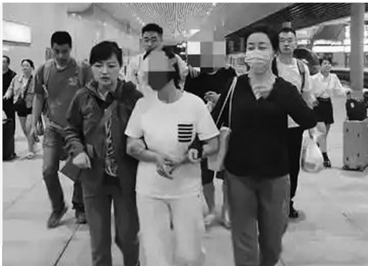
白某某(图中)被警方从陕西抓捕归案