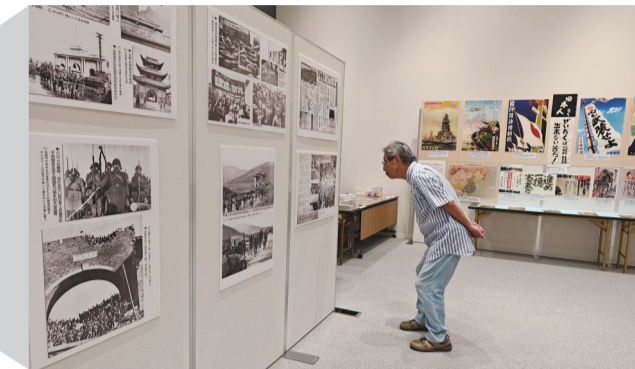
日本参观者认真看展