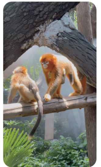
亚洲灵长区馆的川金丝猴

今年以来,红山动物园更新改造频频。6月9日,现代快报记者从南京市发展改革委了解到,根据最新批复,红山将再次扩建一个新场馆,进一步丰富动物种类。新场馆名为河川馆,新建项目包含了河川生态动物展区及服务配套设施,总建筑面积7979平方米。其中河川生态动物展区为2层建筑,总建筑面积6170平方米,地上面积4730平方米,地下建筑面积1440平方米;服务配套