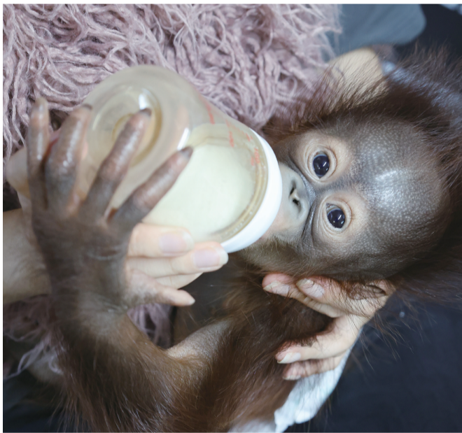
“毛阿妹”萌翻了(扫码看视频)